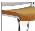
Confortable et robuste