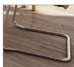
Piètement tube chromé