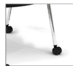
Piètement 4 pieds sur roulettes